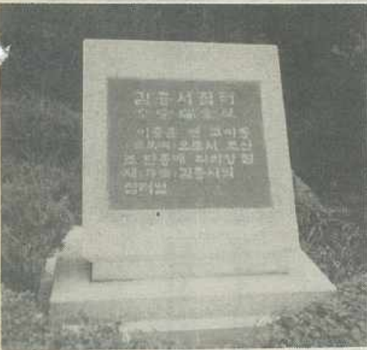
세워진 節齋公 집터에 標石이 세워졌다.