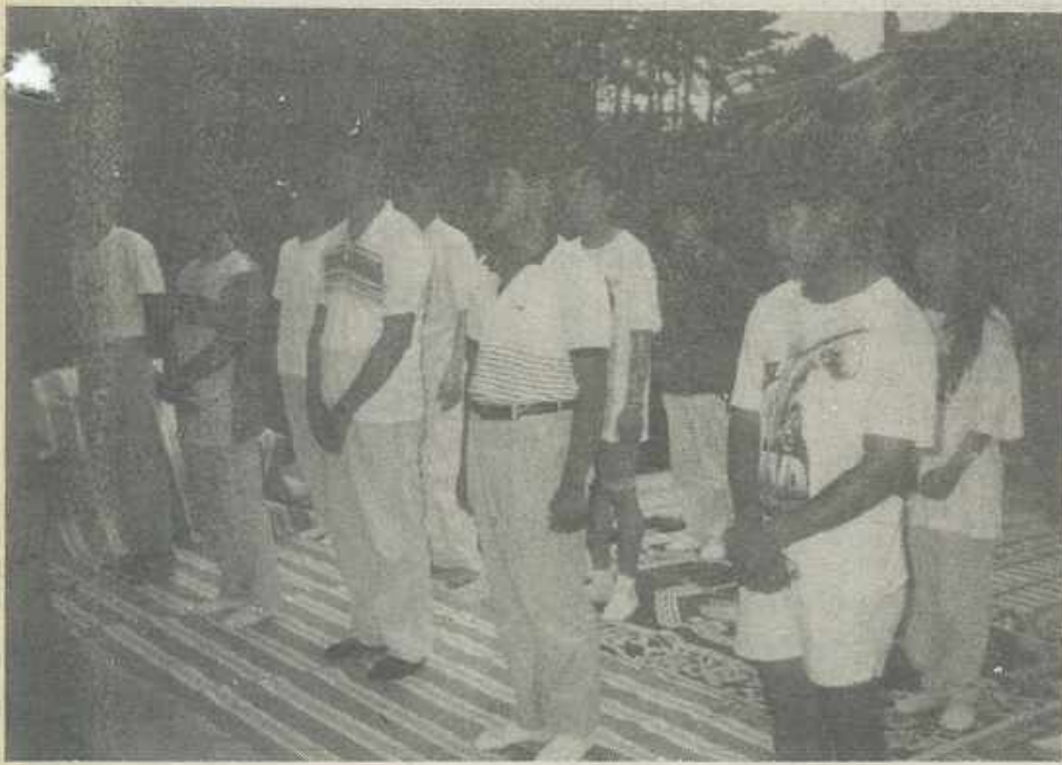
겸천사를 참배한 학생들이 겸천사에 얽힌 선조의 유업을 경청하고 있다.

임소한 첫날, 너무 열악한 환경이라서며 미안해하시며 극기훈련이라 심치고 생활하라시면 어떤의 말씀이 생 각된다. 그러나 이 기간 동안의 생활이 고과서의 책속에 갇힌 지식속에서 살아왔고 그것만을 알았던 우리에게 사회에서의 영연행태의 함을 피부로 접한 시간이었다. (이런 한적한 곳에서 들을 아껴가며