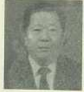
금년의 교양강좌의 실시 기간

5일부터 8월 9일까지 5일간으로 결정하여 수강신청한 학생들에게 입소통지(入所通知)를 내고나니 어깨를 짓누르는 증압감을 느끼고 날씨가 따뜻하지 초조한 나머지 느끼게 됨은 무슨 까닭인가.