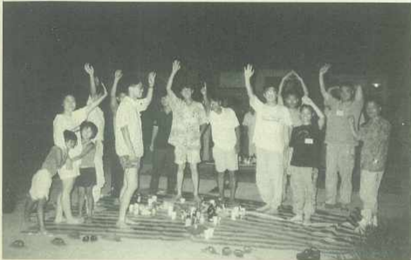
모닥불 앞에서 정담을 나누고

매년 여름에 실시하는 순천김씨의 교양강좌에 참여 한 것을 매우 기쁘게 생각합니다. 내가 어떤분의 자손이며 무슨 파인지 자에겐 무관하게만 느껴지는 것들이 삼박 사일의 일정이 끝난 후에는 저에게 있어서는 무척 중요한 일이 되어버렸습니다. 많이 배웠다는 것보다는 시조묘소와 영당침배를 했다는 것이 중요하며 관혼상제와 족보보는법 조상들의 업적들을 많이 알게 되어서 무척 기쁩니다. 누가 저에게 '어디 김씨예요' 하고 물으면 순천김씨에 대해서 별로 아는게 없어서 대답하기가 힘들었는데 이제는 자신있게 말 할 수 있어서 제일 좋습니다. 평생동안 이번 여름을 잊지않고 이번 교양강좌를 기억하며 생활하고 싶구요. 이런 교양강좌가 끊이지 않고 계속 지속 되었으면 하는 바램입니다.