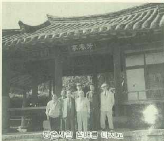
방춘서원 참배를 마치고

이 세 배향되신 애초의 삼(三)과 남(南) 그리고 이남에 새로 추대되신 진사공(進士公)에 대한 설명을 공의 직계 후손인 김재용 명예회장에 의해서 들어보면 공은 131년 신해생으로 는 효손(孝孫)이요 호(號)는 망미당(望美堂)으로 양경공의 현손(玄孫)인 호조참의 지해(之海)공의 아들이시고 담양부사 효우(孝友)공의 아우로서 문종조(文宗朝)에 성균진사(成均進士)에 합격하신 후 그 형님 담양공과 동실거거(同室起居)하며 우애우