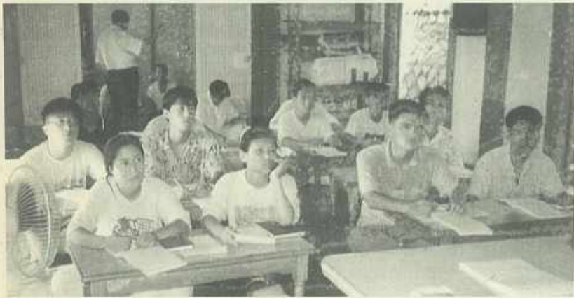
강 의 광 경