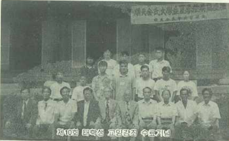
제10회 대학생 교양강좌 수료기념

말하면 비장한 자오로 굳게 맹세하였다 한다. 그러기에 靑田 族형제서는 十年을 두고 한번도 빠짐이 없이 폭염을 무릅쓰고 강의를 맡아왔으며 일부(一無)종친 또한 금년으로 十年째 모든 뒷바라지와 진행을 맡아오니 그간의 우여곡절과 어려움을 이 무다 열거할 수 없으나 작년 제 9회 때는 일부가 신환으로 병원에 입원치료를 받으면서도 강좌 준비에 소홀함이 없도록 하였고 심지어는 간사님들을 병원으로 오시게 하여 지시하는 등의 노력으로 결강을 면하게 하였고 그 후 一年이 지난 지금까지도 불치의 병 임을 선고 받고도 일과 남지 않은 생명이나 다