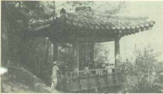
茶山 草堂에 달린 푸자

장미 좋지 않아 부득이 모든 실무에서 손을 떼는 이 마당에서 서원 참배를 주선 안내하고 땅 끝까지 와서 마지막 간사회의를 주재(主宰)하는 모습은 우리 일행을 새삼 감동케 하였다. 다음날 일행은 보길도(甫吉島)에 가서 우리나라 시가의 대가(詩歌의 大家)인 윤고산(尹孤山·尹善道의 雅號)의 고산유고(孤山遺稿) 전회요(遺懷謠) 우후요(雨後謠)의 산실인 낙서재(樂書齋)를 돌아보고 완도(莞島)를 거쳐