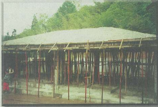
상량식 當時 모습

지난 5월13일 (음4월10일) 정오(12시) 전남 승주군 주암면 우리金門의 시조 동원재 앞 마당에서 鍾植 中央宗親會長, 昌原宗親會長, 光州 宗親會長을 비롯한 全國 宗親은 嘉樂堂(동원재 별관) 上樑式을 舉行 順天金門의 無窮한 發展과 繁昌을 祈願하였다.