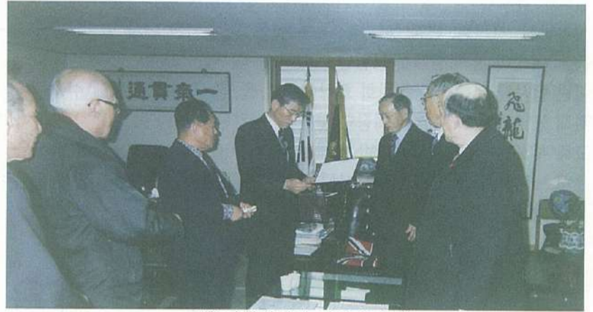
· 昌淵 간행위원장 위촉장 수여 ·